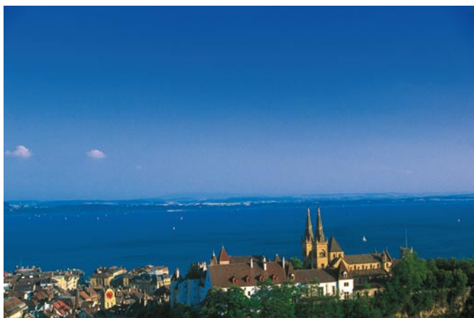
Schweiz Tourismus / Saifuddin F. Ismailji

Il team della statistica del turismo è composto in gran parte da un gruppo di produzione. I collaboratori sono quindi quotidianamente in contatto con gli stabilimenti alberghieri della Svizzera. Questo gruppo è completato da collaboratori scientifici incaricati dell'elaborazione dei dati, dell'analisi, della diffusione e dello sviluppo.