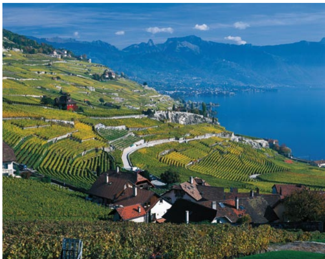
Schweiz Tourismus / Christof Sonderegger