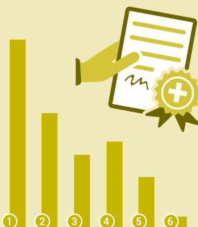
Stgalim secundar II