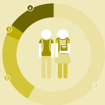
Persunas en scolaziun 2016/17, en millis