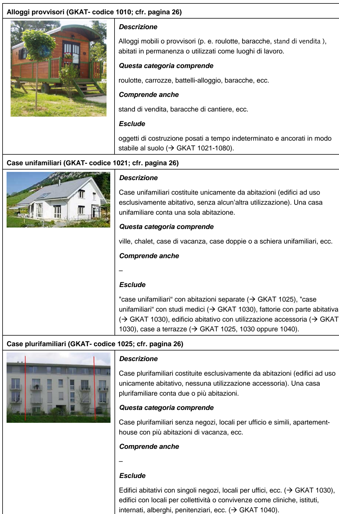
Tabelle 1: Descrizione dell'universo di base degli edifici secondo la categoria